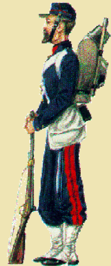
Jean-Pierre-Dupont-und-Pierre-Jean-Dupond Soldaten im 3ème Régiment d'infanterie Armée Clinchaud